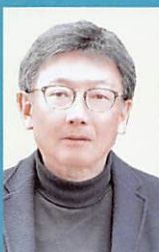
中西 真 東京大学教授