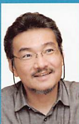
柳沢 正史 筑波大学教授