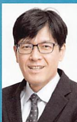
村上 正晃 北海道大学教授