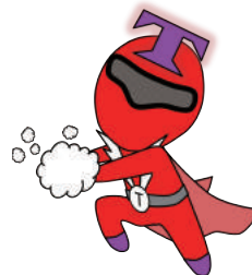
まもるんジャー T 亀山 武志 (助教)