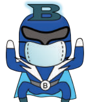
まもるんジャー B 郷 俊寛 (医学研究科)